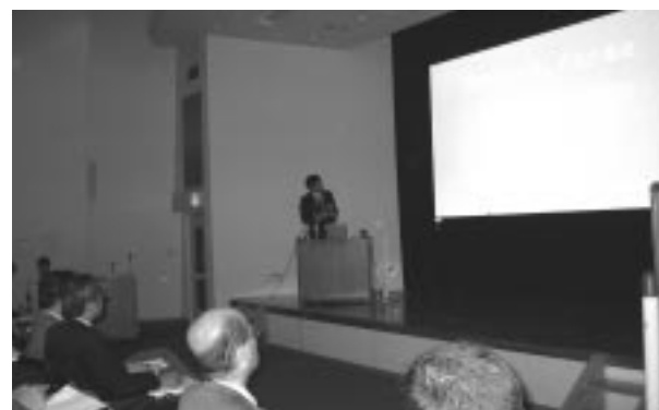
環境研究交流しずおか集会

康で安全な室内環境に向けた取り組み」でした。近頃問題になっていきますシックハウス症候への対策が注目され、多数の参加者とともに活発な討論がなされました。日本学術会議・第5部・計測工