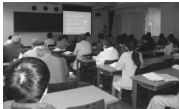
環境学習サポーター養成講座

研究所一般公開当日は天候にめぐまれ、子供たちを含めた約150名の県民が訪れ、研究機器などを非常に興味深く見学していました。子供を対象にした催し物もあり、元気な声が一日中響いていました。環境学習サポーター養成講座は当研究所主催となって2回目を迎えましたが、今回は63名の応募者があり、10月4日から11月22日まで毎週土曜日に開講しました。年配の方の参加が多かったですが、真剣に聴講されていました。環境研究交流しずおか集会の今年のテーマは「健