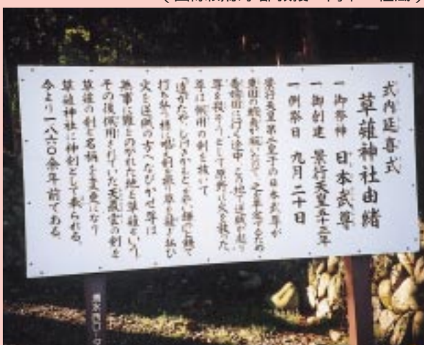
草薙神社を案内する案内板