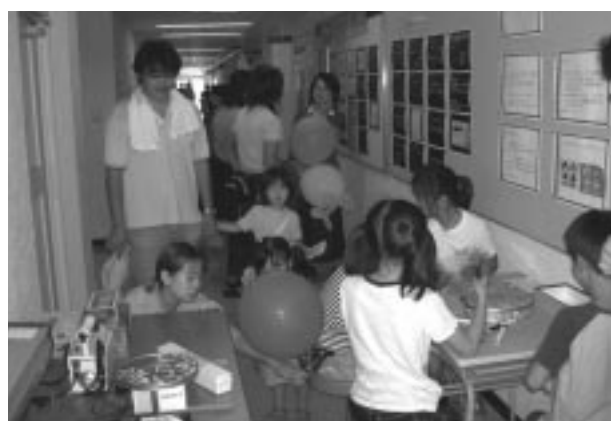
研究所の一般公開

研究所一般公開当日は天候にめぐまれ、子供たちを含めた約150名の県民が訪れ、研究機器などを非常に興味深く見学していました。子供を対象にした催し物もあり、元気な声が一日中響いていました。環境学習サポーター養成講座は当研究所主催となって2回目を迎えましたが、今回は63名の応募者があり、10月4日から11月22日まで毎週土曜日に開講しました。年配の方の参加が多かったですが、真剣に聴講されていました。環境研究交流しずおか集会の今年のテーマは「健