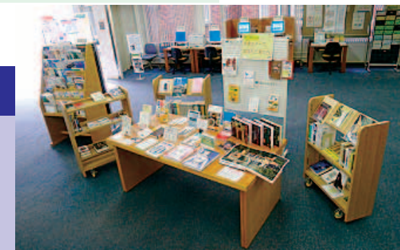
県立大学附属図書館の展示