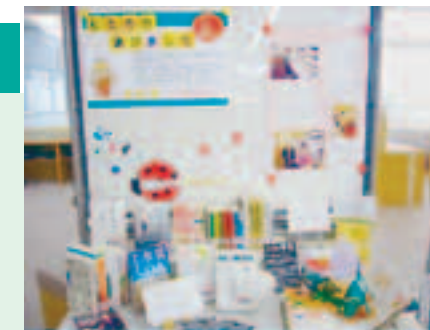
短期大学部附属図書館の展示

今では本の売れ行きを左右するという手作りポップ、最近はその書店もポップ作りに力を入れています。どうしたらこの本をお客さんに手に取ってもらえるか、本の魅力を伝えるにはどうしたらよいか、書店員になったつもりで作るのも楽しい！