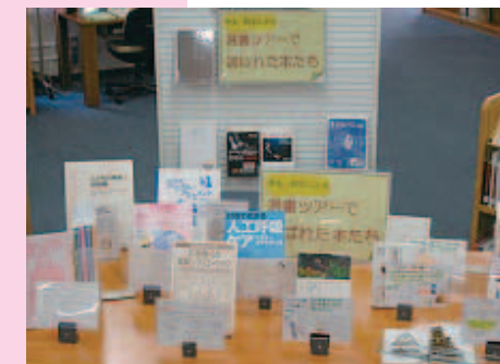
手作りポップが効果的です。