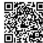
駅からのアクセス方法