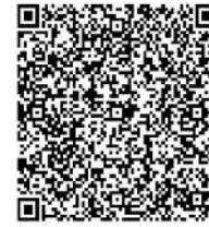
静岡県立大学 草薙キャンパス