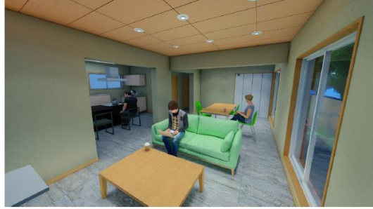
交流スペース ラウンジ