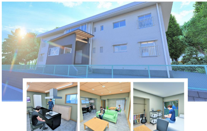
つつじヶ丘国際学生寮 完成イメージ図

静岡にいながら国際交流がしたい、多国籍な環境に身を置いて英語力や異文化対応力を向上させたい、留学生を支援したい…など、興味のある方は、ぜひご応募ください！