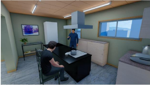
交流スペース キッチン