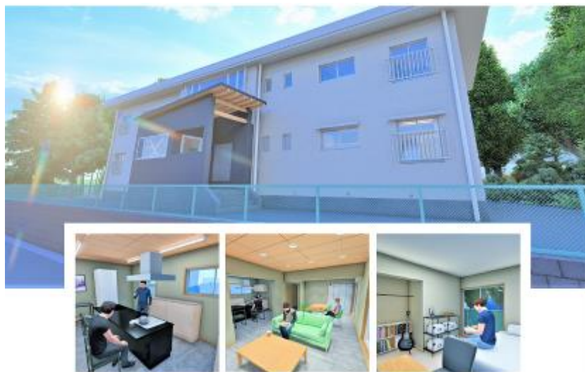
つつじヶ丘国際学生寮 完成イメージ図

静岡にいながら国際交流がしたい、多国籍な環境に身を置いて英語力や異文化対応力を向上させたい、留学生を支援したい…など、興味のある方は、ぜひご応募ください！