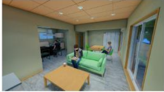
交流スペース ラウンジ