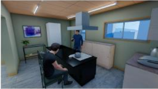
交流スペース キッチン